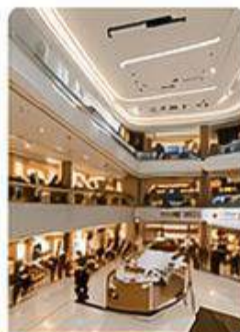
TRUNG TÂM THƯƠNG MẠI